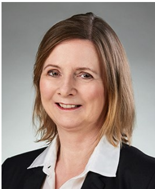
Senior Managerin, Restrukturierungspartner jwt GmbH & Co. KG